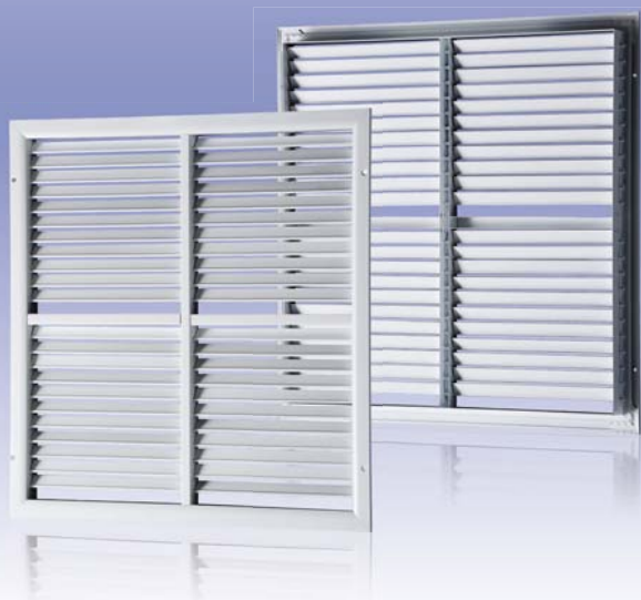
Однорядная секционная вентиляционная решетка с регулируемыми направляющими воздушного потока