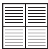
ОРК1 – параллельное расположение направляющих воздушного потока